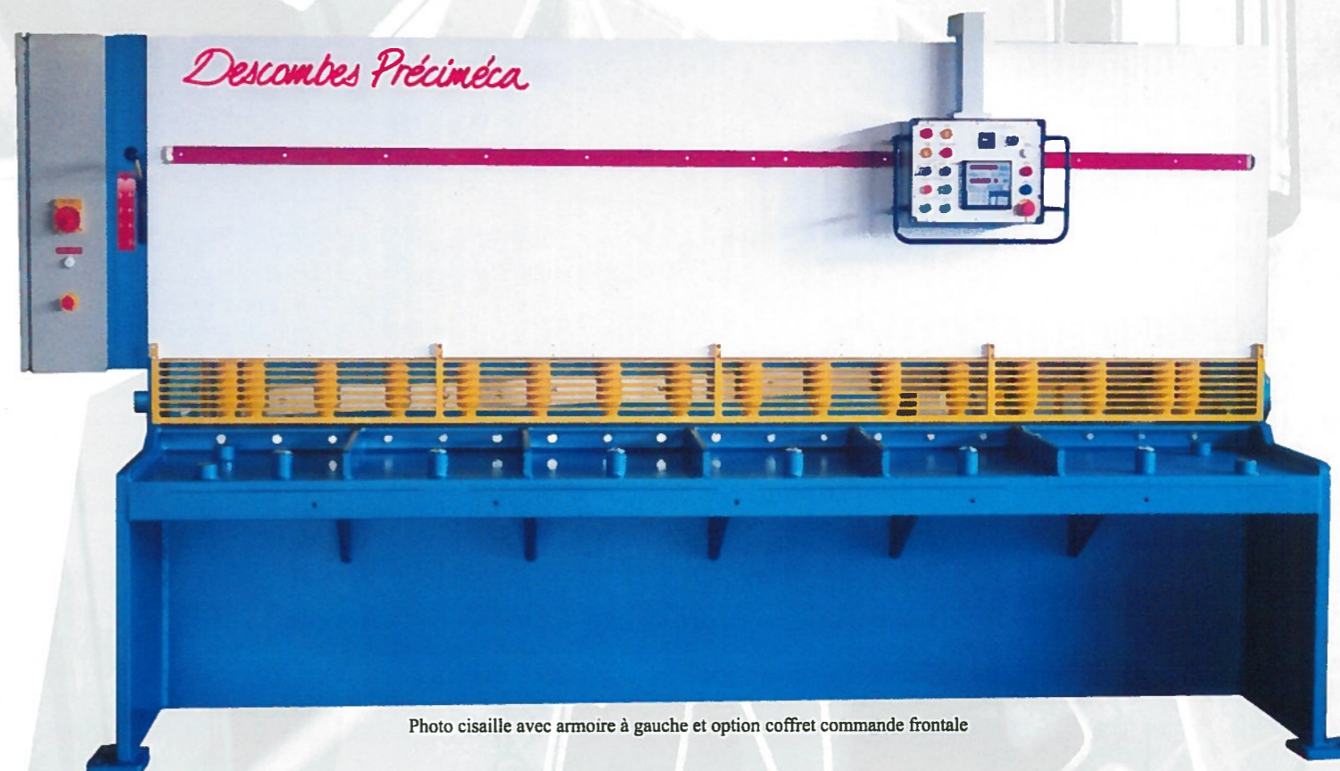
Photo cisaille avec armoire à gauche et option coffret commande frontale

Vous recherchez une coupe excellente avec la meilleure QUALITE DE CISAILLAGE (en bande étroite = vrillage mini) et une excellente VISIBILITE DE LA LIGNE DE COUPE au tracé. CECI EST NOTRE SAVOIR FAIRE.