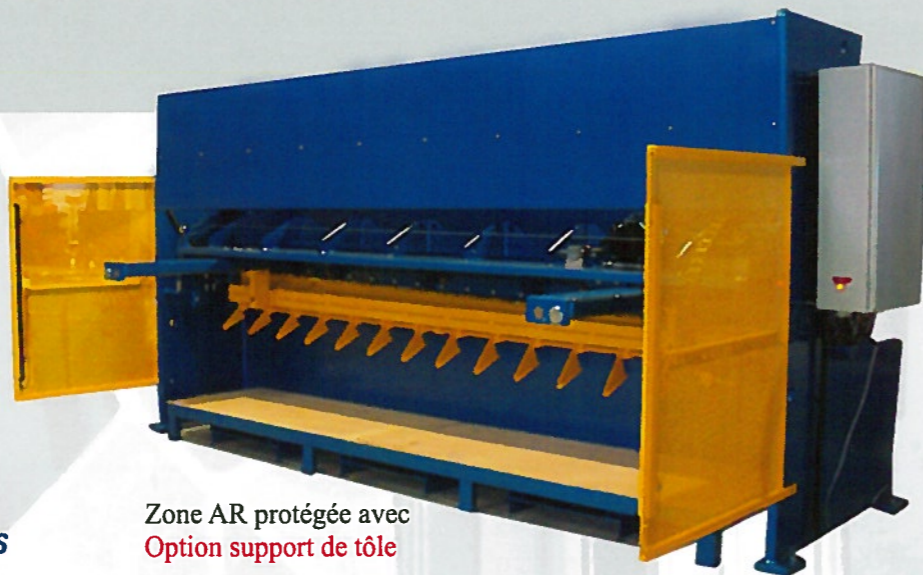
Zone AR protégée avec Option support de tôle