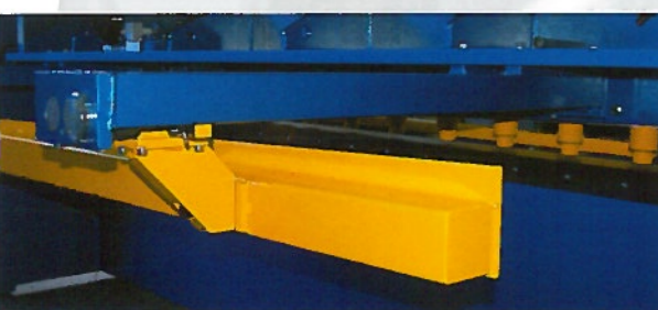
Vue poutre butée arrière

Choisir une machine de capacité adaptée à vos besoins : Longueur, épaisseur et qualité de la coupe. Angle de coupe = vrillage minimum des bandes Rapidité et précision du réglage angle de coupe et jeu entre lames Equipement standard et options proposées Qualité du SAV + rapidité