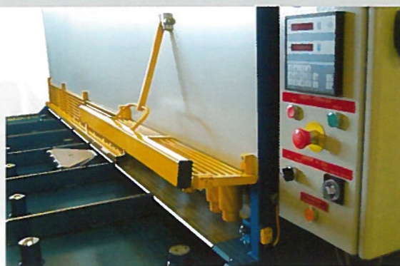
Option 25 bis Partie de grille à ouverture contrôlée Niveau 4