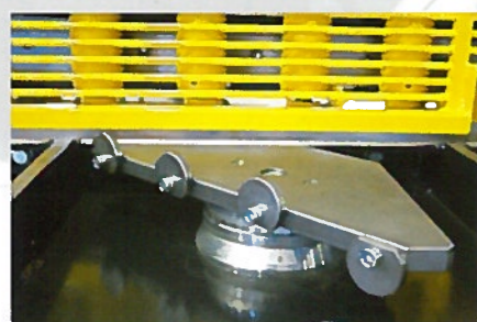
Option 15 - Rapporteur d'angle

Guide d'équerrage capacité 1000 monté goupillé - Précision