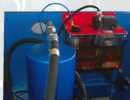
Option graissage automatique

Gamme de production CISAILLE Mécanique et Hydraulique Cisaille à commande numérique Cisaille spéciale pour la sidérurgie